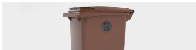
REJILLA DE AIREACIÓN SUPERIOR