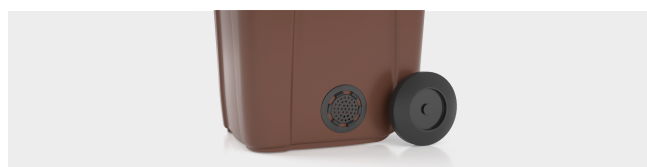
REJILLA DE AIREACIÓN INFERIOR