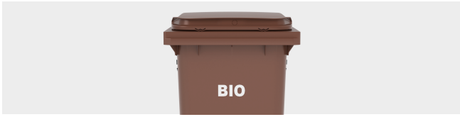
PERSONALIZACIÓN POR TERMOIMPRESIÓN