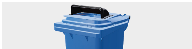
BOCA RECTANGULAR PARA PAPEL