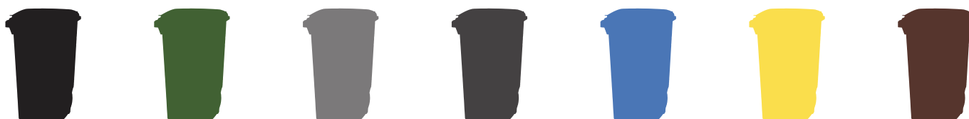
AMPLIA GAMA DE COLORES