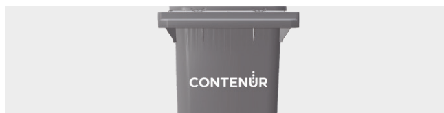
PERSONALIZACIÓN POR TERMOIMPRESIÓN