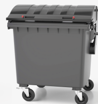
C1100 Tapa Curva