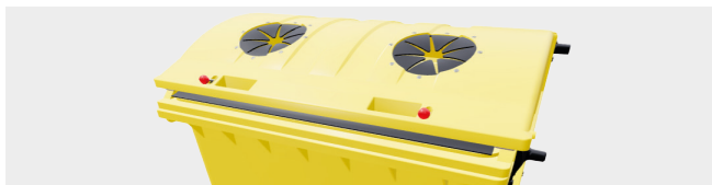
BOCAS PARA ENVASES