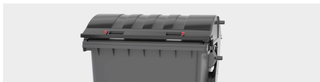
SISTEMA DE BLOQUEO