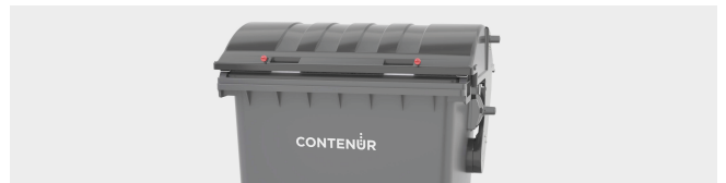
PERSONALIZACIÓN POR TERMO IMPRESIÓN