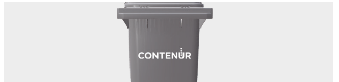
PERSONALIZACIÓN POR TERMOIMPRESIÓN