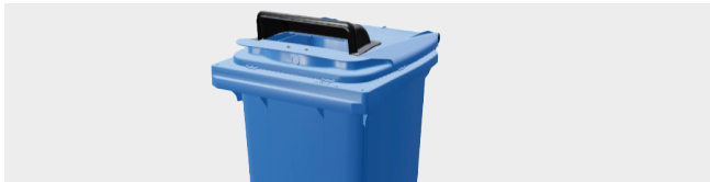
BOCA RECTANGULAR PARA PAPEL