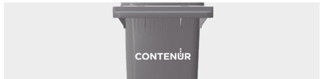
PERSONALIZACIÓN POR TERMOIMPRESIÓN