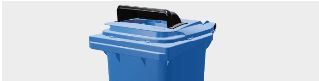
BOCA RECTANGULAR PARA PAPEL