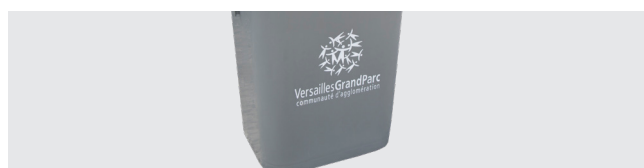
PERSONNALISATION AVEC THERMOIMPRESSION