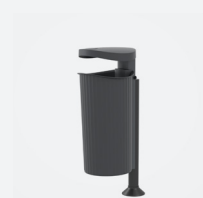
Italica 50 L