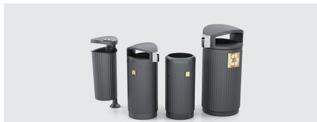
FAMILLE DE CORBEILLES ÁGORA