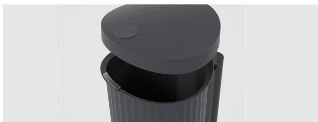
PLAQUE D'EXTINCTION DE CIGARETTES