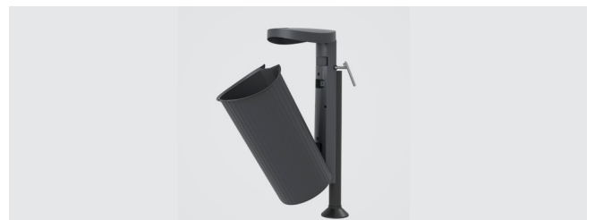
SYSTÈME DE FIXATION