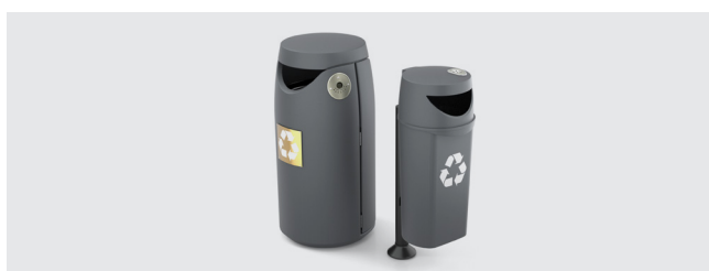
FAMILLE DE CORBEILLES EUROPA