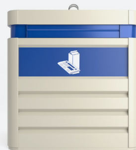
Personalización mediante serigrafía