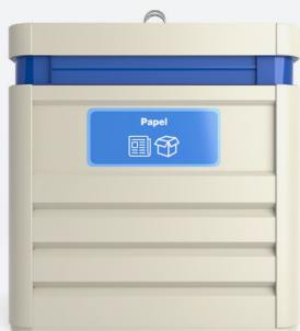
Personalización con pegatina o vinilo adhesivo

Zona trasera, dimensión máxima: 850 x 240 mm