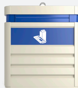
Personnalisation par sérigraphie