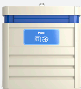
Personnalisation avec autocollant ou vinyle adhésif

Zone arrière, dimension maximale: 850 x 240 mm