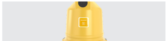
PERSONNALISATION AVEC AUTOCOLLANT OU VINYLE ADHESIF