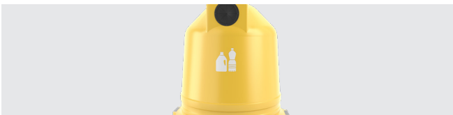
PERSONNALISATION AVEC SÉRIGRAPHIE