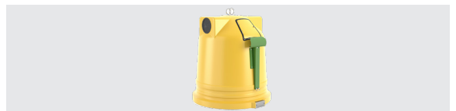
SYSTÈME POUR GRANDS PRODUCTEURS