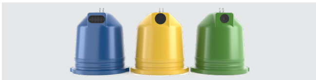
ÎLE IGLOO CIRCULAIRE

Possibilité de personnaliser le conteneur avec différents accessoires pour proposer des solutions adaptées à chaque besoin.