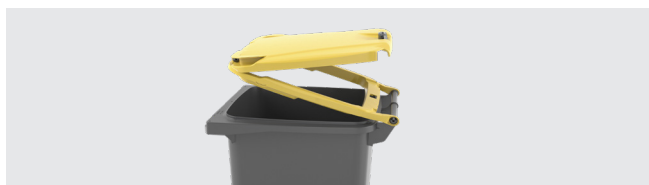
SYSTÈME À DOUBLE COUVERCLE