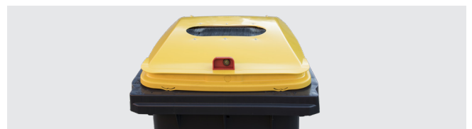
ORIFICE BROSSÉ POUR EMBALLAGES