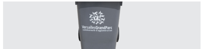
PERSONNALISATION AVEC THERMOIMPRESSIION