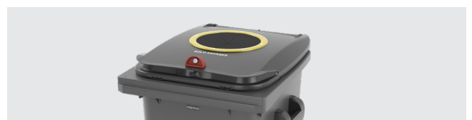
ORIFICE VERRE ET EMBALLAGES