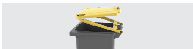
SYSTÈME À DOUBLE COUVERCLE