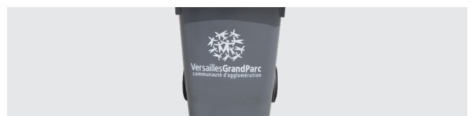
PERSONNALISATION AVEC THERMOIMPRESSION