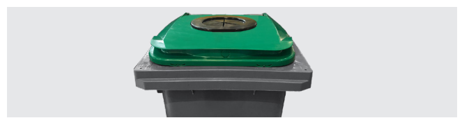
ORIFICE VERRE ET EMBALLAGES