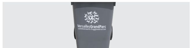
PERSONNALISATION AVEC THERMOIMPRESSION