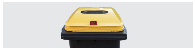
ORIFICE BROSSE POUR EMBALLAGES