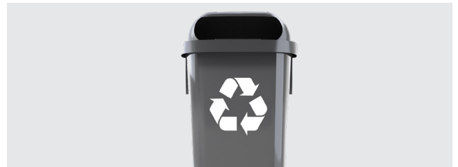
PERSONNALISATION AVEC THERMOIMPRESSION