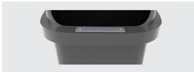
EXTINCTION DE CIGARETTES