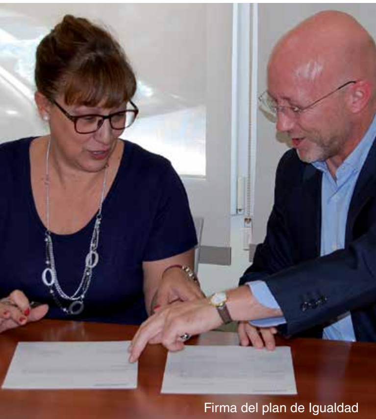
Firma del plan de Igualdad