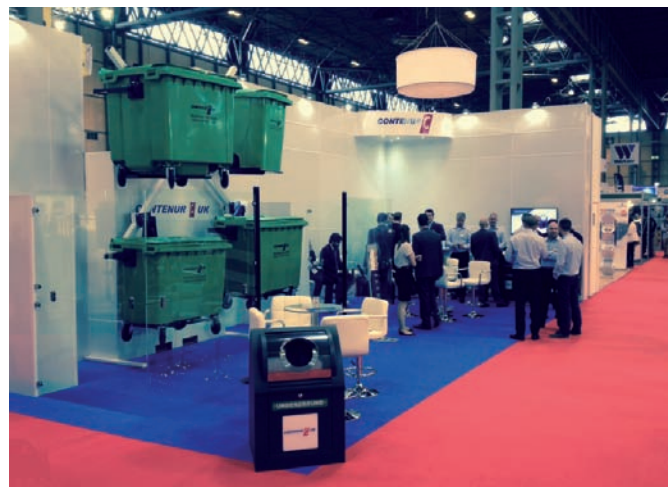
Nuevo stand de Contenur Uk en la feria RWM de Birmingham

Contenur UK instaló un nuevo stand con la peculiaridad de que nuestros contenedores estaban sostenidos por una ruleta giratoria en una de las paredes de nuestro espacio. Además, los clientes han podido informarse ampliamente sobre nuestra oferta de productos y servicios. El stand estuvo atendido por el equipo comercial de Contenur UK.