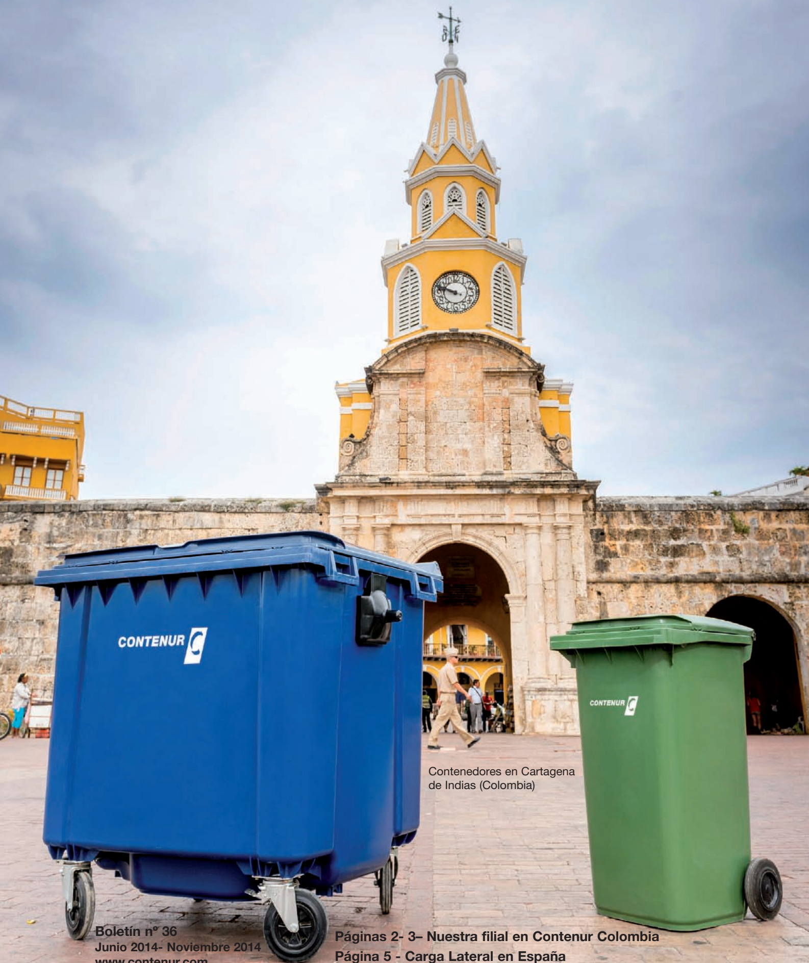
Contenedores en Cartagena de Indias (Colombia)