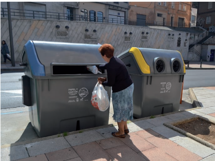
Ciudadana reciclando haciendo uso del nuevo contenedor de Contenur

El ayuntamiento de Ponferrada, en la provincia de León, ha comenzado a implantar en toda la ciudad los nuevos contenedores de 3.200 L de carga lateral para la recogida de R.S.U, papel y cartón y envases ligeros.