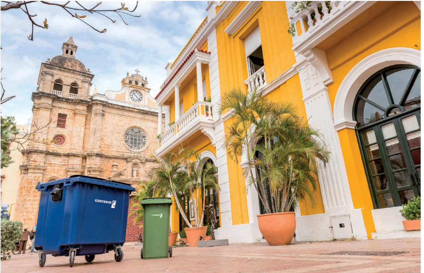
Contenedores Contenur en Cartagena de Indias (Colombia)