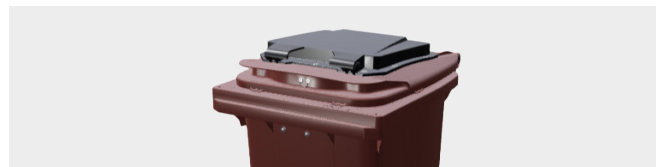
DECKEL IM DECKEL