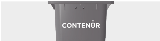
PERSONALISIERUNG DURCH THERMOTRANSFER-GRAFIK