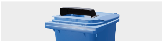
PAPIEREINWURF MIT HAUBE