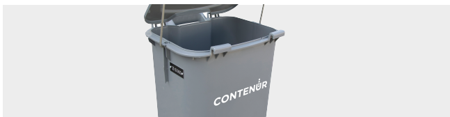
CUSTOMISATION WITH STICKER