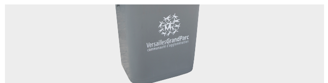
CUSTOMISATION BY THERMAL TRANSFER GRAPHIC