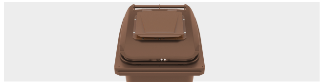
DECKEL IM DECKEL