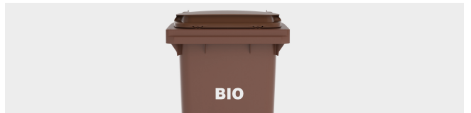
KENNZEICHNUNG DURCH THERMOTRANSFER GRAFIK