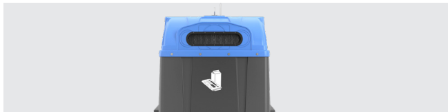
PERSONALISIERUNG MIT SIEBDRUCKGRAFIK