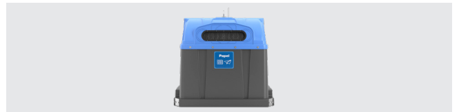
PERSONALISIERUNG MIT AUFKLEBER