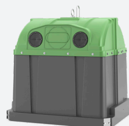
Iglu 3200 L