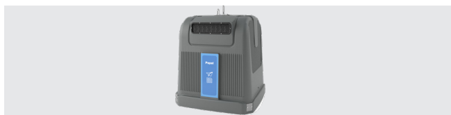
PERSONALISIERUNG MIT AUFKLEBER