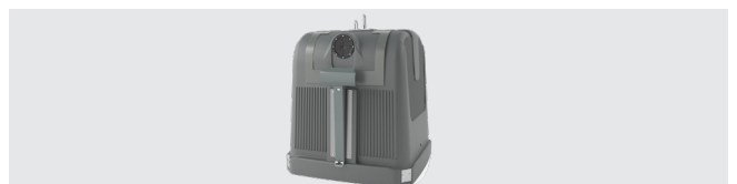
SYSTEM DER GROSSERZEUGER