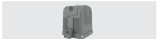
EINWURF FÜR KINDER