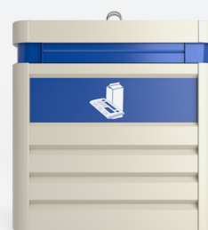
Personalisierung mit aufklebern.