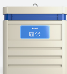
Personalisierung im siebdruckverfahren.