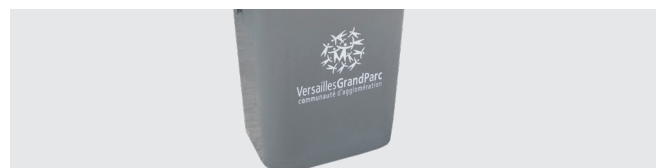
PERSONALISIERUNG DURCH THERMOTRANSFER-GRAFIK