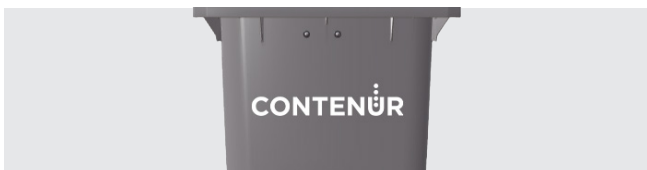
PERSONALISIERUNG DURCH THERMOTRANSFER-GRAFIK