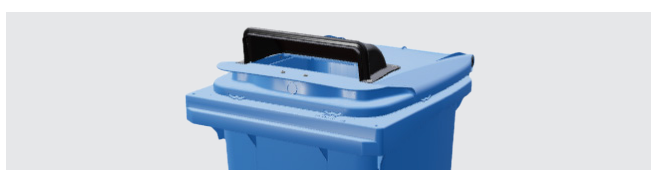
PAPIEREINWURF MIT HAUBE