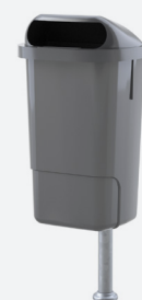
DIN 50 L