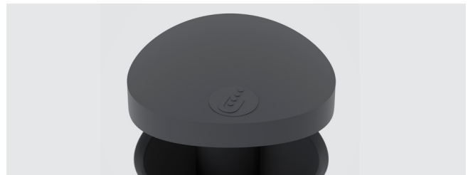
PERSONALISIERUNG DES DECKELS