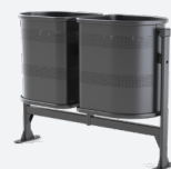
Abfallbehälter Barcelona 220 L City