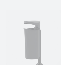
Italica 50 L