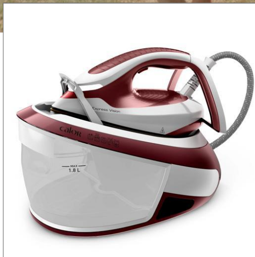
Express Vision 6,8 bars Rouge et Blanche Centrale vapeur SV8150C0