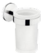
262 01 52 BRUSH-HOLDER PORTACEPILLOS