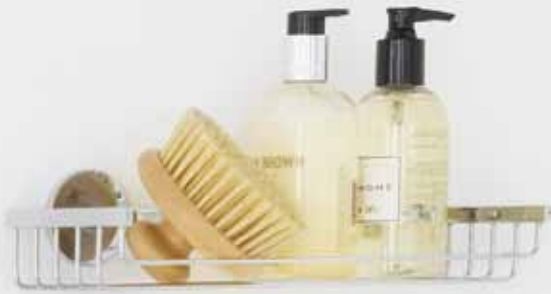
262 01 49 RACK SOAP DISH JABONERA REJILLA