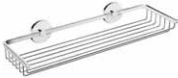
262 01 48 BASKET CONTAINER