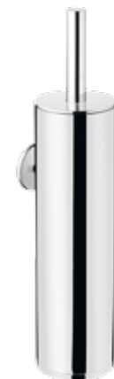
262 01 01 TOILET BRUSH ESCOBILLERO