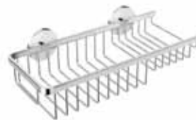
262 01 87 RIGHT BI-LEVEL BASKET CONTAINER ESCALON DERECHO