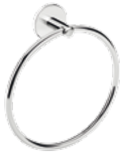
262 01 72 TOWEL RING TOALLERO ARO