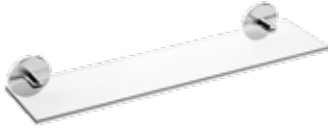
262 01 44 GLASS SHELF ESTANTE VIDRIO