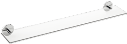
262 01 45 GLASS SHELF ESTANTE VIDRIO