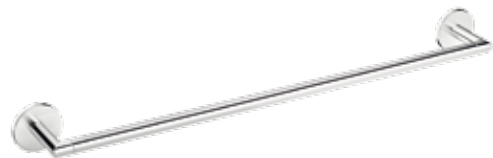
262 01 65 TOWEL RACK TOALLERO