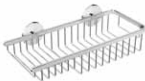
262 01 88 LEFT BI-LEVEL BASKET CONTAINER ESCALON IZQUIERDO