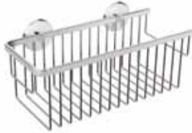
262 01 42 BASKET CONTAINER