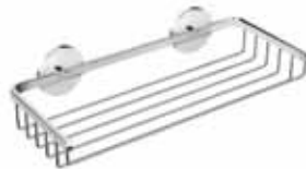
262 01 33 BASKET CONTAINER