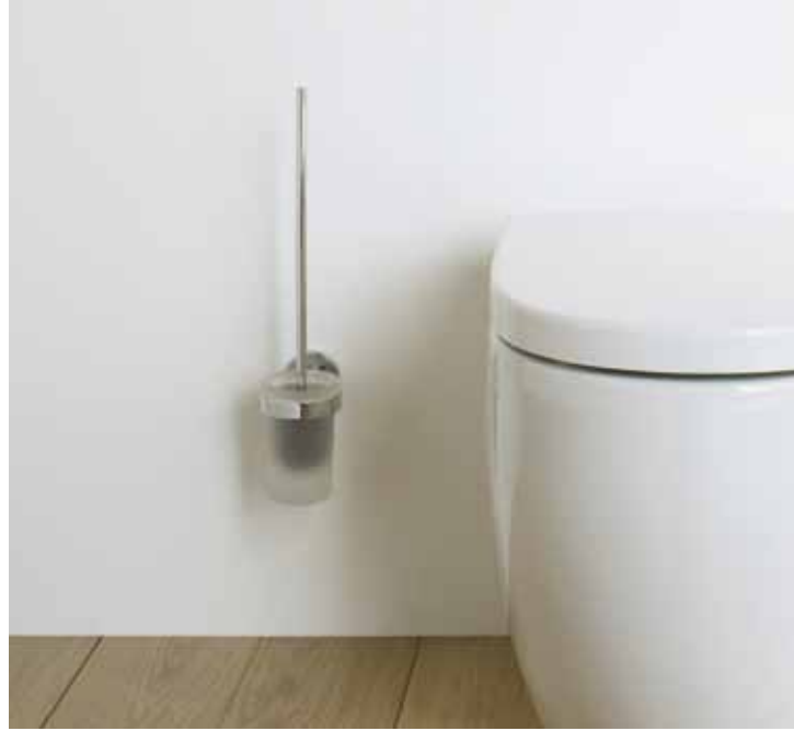
262 01 00 TOILET BRUSH ESCOBILLERO