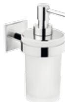
264 01 05 SOAP DISPENSER DOSIFICADOR