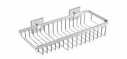
264 01 88 LEFT BI-LEVEL BASKET CONTAINER ESCALON IZQUIERDO