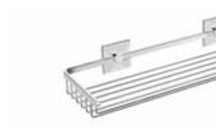
264 01 48 BASKET CONTAINER