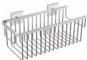
264 01 42 BASKET CONTAINER