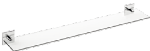
264 01 45 GLASS SHELF ESTANTE VIDRIO