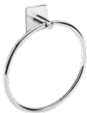
264 01 72 TOWEL RING TOALLERO ARO