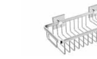
264 01 87 RIGHT BI-LEVEL BASKET CONTAINER ESCALON DERECHO