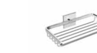
264 01 30 BASKET CONTAINER