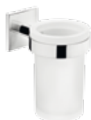
264 01 52 BRUSH-HOLDER PORTACEPILLOS