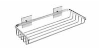
264 01 33 BASKET CONTAINER