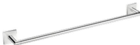
264 01 65 TOWEL RACK TOALLERO